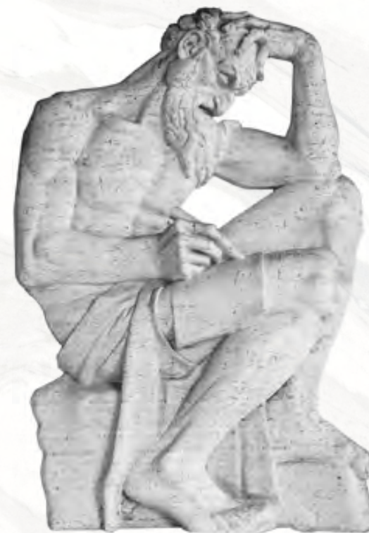
Ivan Meštrović: Sveti Jeronim

Nakon znanstvenoga programa sudionici kolokvija i ostali gost nazočit će svetoj misi u Hrvatskoj crkvi sv. Jeronima u Rimu.